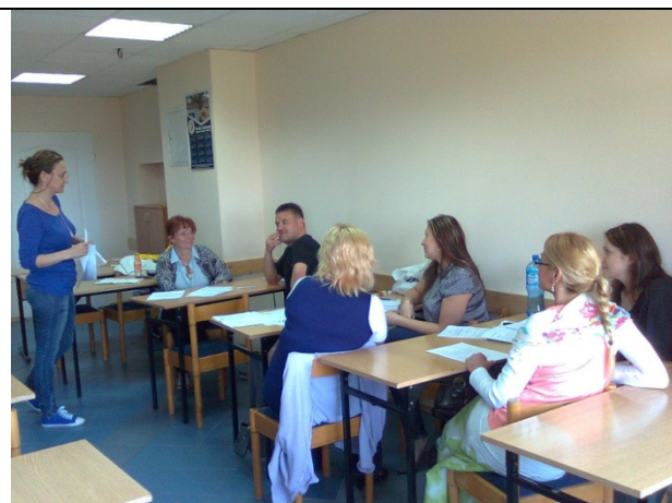
Wsparcie indywidualne Gdynia 14 – 15 maj 2011

DZIĘKUJEMY ZA UDZIAŁ W WARSZTACIE I ZAPRASZAMY NA NASTĘPNE SPOTKANIA I DO ODWIEDZANIA NASZEJ STRONY