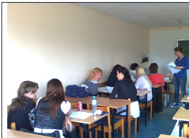
Praca w parach Gdynia 14 – 15 maj 2011

Parę fotek, jak pracowali uczestnicy i praktykantka?