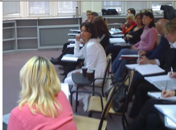
14 grudnia 2008 – Gdynia ul. 10-go lutego 24