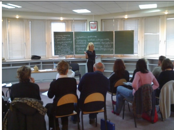
13 grudnia 2008 - Gdynia ul. 10-go lutego 24